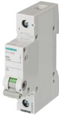
отключ. выключатель 32 А 1-пол.