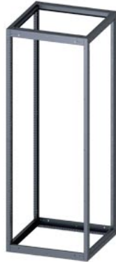
SIVACON, каркас, для стандартного неукomплектованного корпуса, В: 2200 мм, Ш: 800 мм, Г: 800 мм, RAL 7035