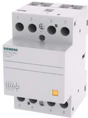
контактор INSTA с 4 НО контакт на 230 В AC, 400 В 40 А управляющее напряжение 24 В AC/DC