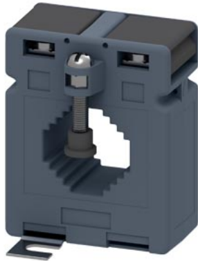
трансформатор тока 1000/5А 5 ВА, кл. 0,2s