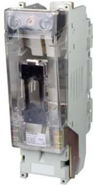
цоколь предохранителя NH разм. 4A, 1-пол., 1250 A, 690 В с плоским контактом