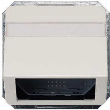
DELTA profil, цвет: титановый белый скошенный выход для световодов