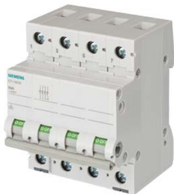
отключ. выключатель 63 А 4-пол.