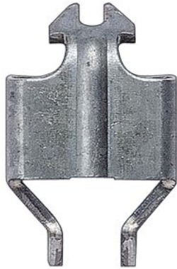
DELTA, удлинительные лапки для вставок устройств с резиной (1 комплект = 10 шт. в пакете)