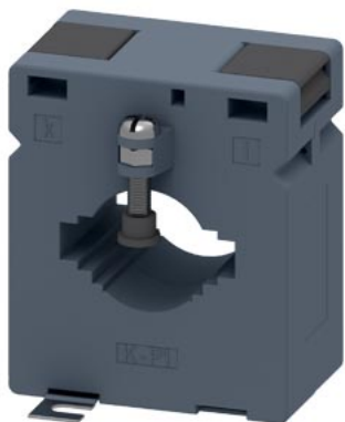
трансформатор тока 750/1A 5 VA, кл. 0,5