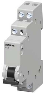
групповой выключатель 20 А, 1 группа