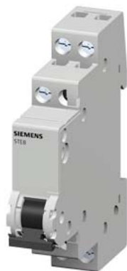
контрольный выключатель 20 А 1 НО 1 лампа 48 В