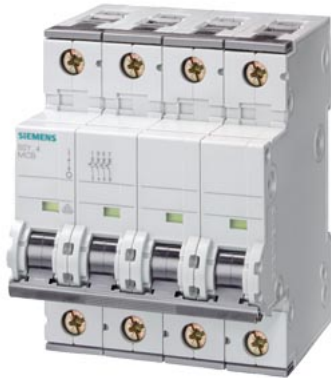
линейный автомат защиты 400 В 6 кА, 3+N-пол., В, 10 А, Г = 70 мм