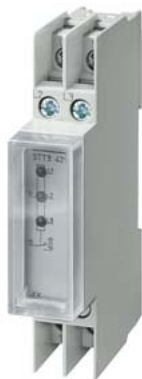
реле контроля фаз 230 В AC 4 А