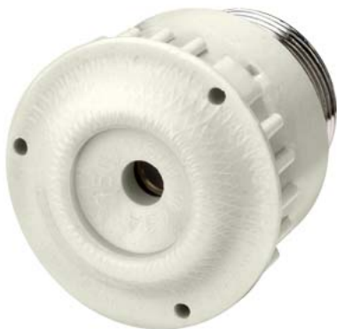
DIAZED, резьбовой колпачок DIII 63 A 750 В AC/DC, керамика для цоколей 5SF4 230