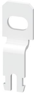
Серьга для крепления винтами, типоразмер S00/S0