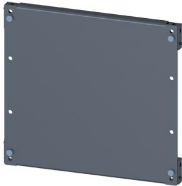
SIVACON, монтажная панель, крепление посредством уголков, В: 300 мм, Ш: 400 мм, оцинков.