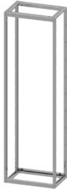
SIVACON S4, каркас, В: 2000 мм, Ш: 600 мм, Г: 400 мм