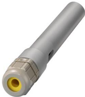
погружной электрод, вода высокой степени очистки