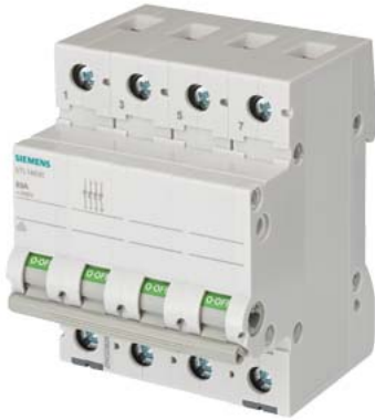
отключ. выключатель 32 А 4-пол.