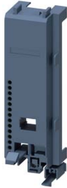
Основание контактора, типоразмер S00/S0