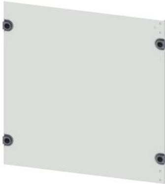
SIVACON S4, панель-заглушка В: 500 мм, Ш: 800 мм