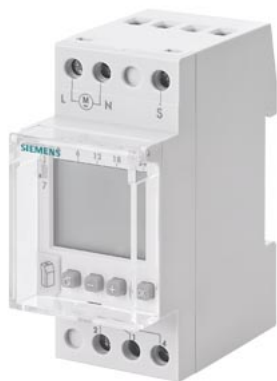
недельный таймер ASTRO цифровой 230 В 16 А 1-кан. 2 мод