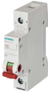
отключ. выключатель 63 А 1-пол., с красной рукояткой