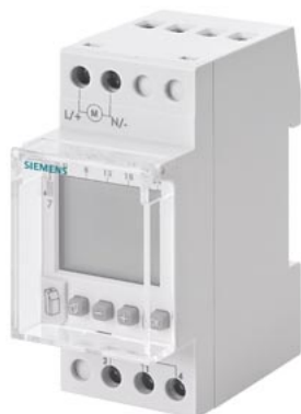
недельный таймер Profi цифровой 24 В 16 А 1-каб. 2 мод