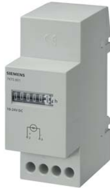
механический счетчик импульсов 24 В DC