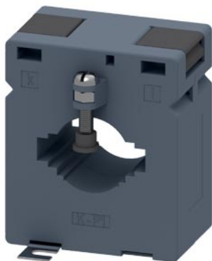
трансформатор тока 400/5A 5 VA, кл. 0,5