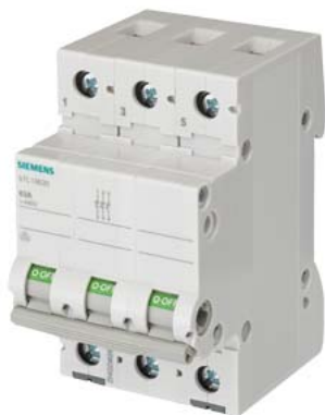
отключ. выключатель 63 А 3-пол.