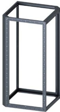
SIVACON, каркас, для углового корпуса, В: 2000 мм, Ш: 1000 мм, Г: 1000 мм, оцинков.