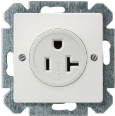
DELTA I-system розетка NEMA цвет: титановый белый 2-пол.+E NEMA 5-20 R 125 В 20 А