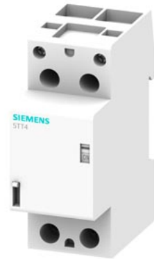
дистанционный выключатель контакт на 40 А напряжение 24 В AC 2 НО