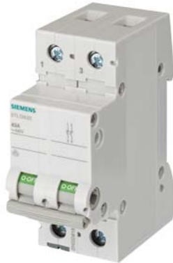
отключ. выключатель 63 А 2-пол.