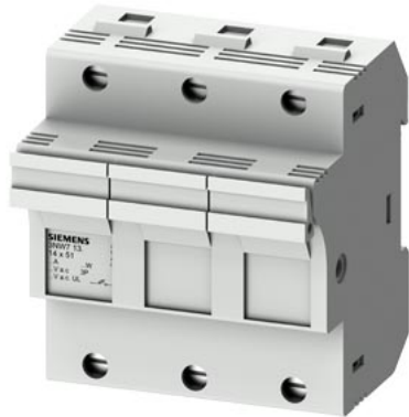
SENTRON, держатель цилиндрических предохранителей, 14x51 мм, 3-пол., In: 50 A, Un AC: 690 В