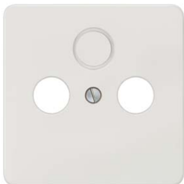
DELTA profil, лицевая панель для TV/RF/SAT 2 и 3-отв., выламываемые цвет: титановый белый