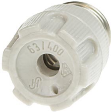
наворачивающийся колпачок NEOZED фарфор, размер D01, 16 А