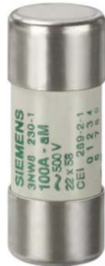
SENTRON, цилиндрическая вставка предохранителя, 22x58 мм, 100 A, aM, Un AC: 500 В