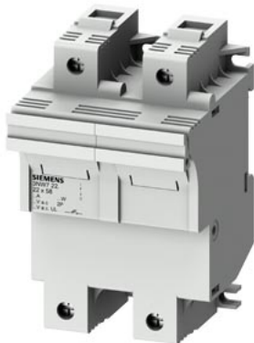
SENTRON, держатель цилиндрических предохранителей, 22x58 мм, 2-пол., In: 100 A, Un AC: 690 В, светодиодный сигнализатор