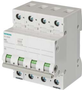
отключ. выключатель 32 А 3-пол.+N