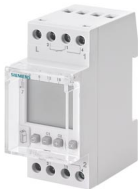
недельный таймер ASTRO цифровой 230 В 16 А 2-кан. 2 мод