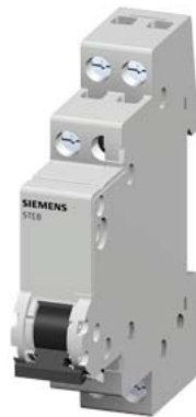
отключ. выключатель 20 А 1 НО