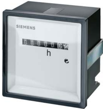
счетчик времени 72 x 72 мм 10-50 В DC без клеммной крышки