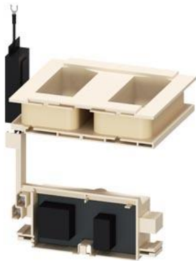
Катушка электромагнита с электроникой включения для контактора 3TF6844-...C..., 230–276 В AC, 50/60 Гц