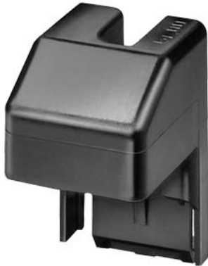
крышка ISO для цоколя предохранителя NH размер 3