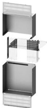
разделитель SIVACON S4 соединительная панель 3WL BG I, Ш: 600 мм Г: 800 мм